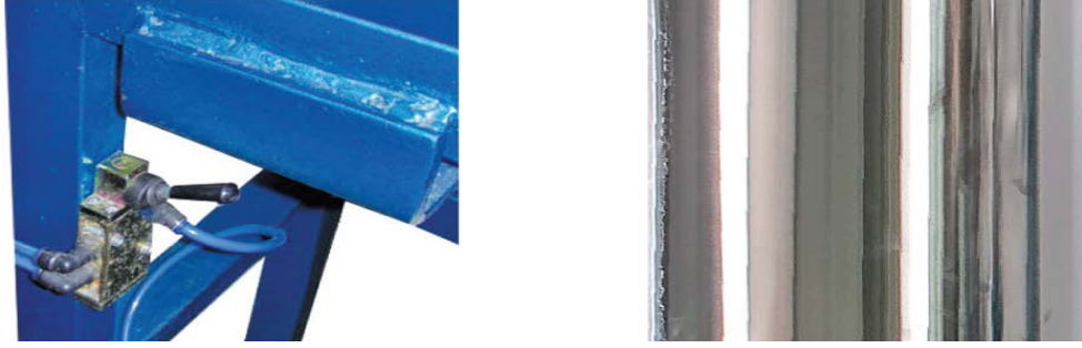
Şekil 2 Su Tahliye Vanası ve Su Tankı