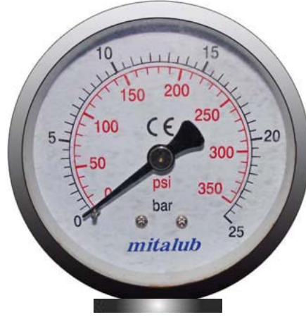
Şekil 5 Manometre