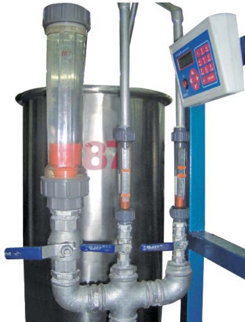
Şekil 3 Debimetre

• Üçüncü hat üzerinden 1 m 3 /h ile 10 m 3 /h debilerin ayarlanması gerçekleştirilir. Bu ayarlama 1 m 3 /h ile 10 m 3 /h debiler arasında çalışma sahası olan sütunlu bir debimetre ile yapılır. Debimetrenin taksimatı 0.01'dir. Ayarlama sırasında kullanılan pirinç vana 1 1/2" çapındadır.