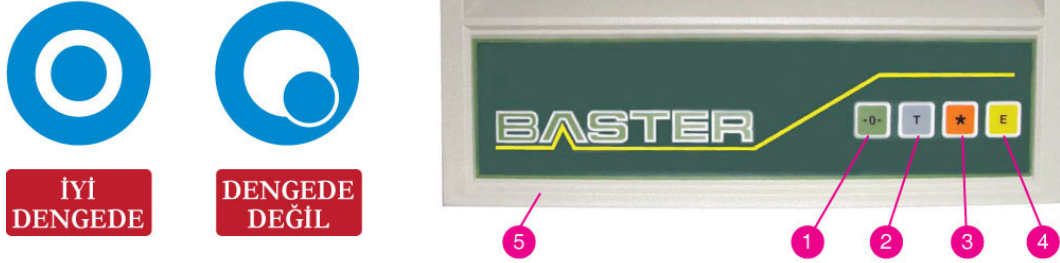
Şekil 4 Teraziler